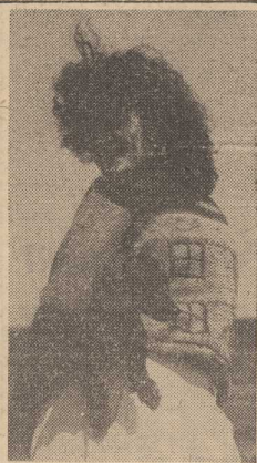
...razem z moim psem.

Na miejscu przybyli niezwłocznie naukowcy z uniwersytetu w Hamburgu, którzy kontynuowali już fachowo prace badawcze. Udało im się wydobyc w dobre zachowanym stanie mierząca dwa metry czaszkę, kości oboczniaka, kręgi szyjne oraz kilka żeber. Na razie naukowcy badają znalezione kości. Mają nadzieję, że gdy uzyskają niezbędne dla nauki dane, na podstawie znaleziska utworzą całość wieloryba. Zostanie on wystawiony w muzeum, w dzielnicy znalezisk paleontologicznych.