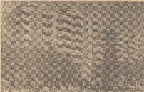
NOWE bloki mieszkalne przy bulwarze Tomis w Konstancy.

DZIŚ Socjalistyczna Republika Rumunii obchodzi swoje narodowe święto. Przed 41 laty, właśnie 23 sierpnia, wojska radzieckie w ramach operacji bałkańskiej przystąpiły do wyzwolenia Rumunii. W tym samym czasie postępowe siły rumuńskie skupione w bloku narodo-demokratycznym obalili prohitlerowską dyktaturę marszałka Antonescu. Ruch, w którym kluczową rolę odgrywała Rumuńska Partia Komunistyczna, spowodował przełomowe, historyczne zmiany wazące na dalszych losach kraju. Tradycyjnym zwyczajem prezentujemy materiały przygotowane przez kolegów z dziennika „Dobrogea Noua” ukazującego się w Konstancy. Z tą redakcją utrzymujemy od lat serdeczne, przyjacielskie kontakty.