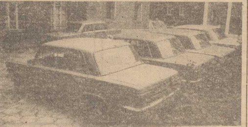
SKRADZONE, a następnie odzyskane samochody, trafiły do WUSW w Szczecinie. Te które znajdują się na naszym zdjęciu oczekują na właścicieli.

O GÓDZ. 11.15 w Mysłoborzu Magdyn wybuchł pożar posesycji leśnego. Jak się okazało (już po uszeregowaniu) ogień przetrzasnął się na sąsiednią uprawę sosenową i po godzinie strażacy znowu przystąpili do akcji. Spłonęły w sumie 3 ary uprawy, wartości 20 tys. zł. Wg. wsi Tużec gm. Przycze zapaliła się na polu o powierzchni blisko 1 ha słoma po kombajnie, od której zajął się las przemyły. Straty — 12 tys. zł. W Pólskiej wybuchł pożar w sąsiedniej frytki — zapalił się właściciel, oświadczył, że obszar olei na frytkownicy. Straty — 20 tys. zł. (mk)