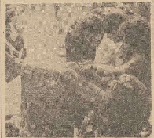
ZAKOPIAŃSKIE Krupówki — odpoczynek przed wywieceniem w góry. CAF — St. Momot