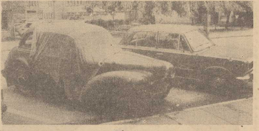
WETERAN szos czeka na renowację... Niestety, w wielu przypadkach trwa to za długo i samochody — niby jeszcze „na chłodzie” — przestają się w szpecącą otoczenie kuppą zardzewiałego złomu.

10 NAJLEPSZYCH uczniów i studentów skorzystało w tym roku z możliwości wyjazdu na Międzynarodowe Obozy Pracy w krajach kapitalistycznych: 3 uczestników wyjechało do Wlk. Brytanii, 2 do Francji, 2 do RFN, po jednym do Hiszpanii, Szwajcarii i Danii. Warunkiem wyjazdu było m.in. pozytywne zdanie egzaminu przed komisją językową. Uczestnikom MOP nie płaci się za pracę w walucie danego kraju, a zarobione przez nich pieniądze przeznaczone są na utrzymanie i organizację czasu wolnego. (MK)