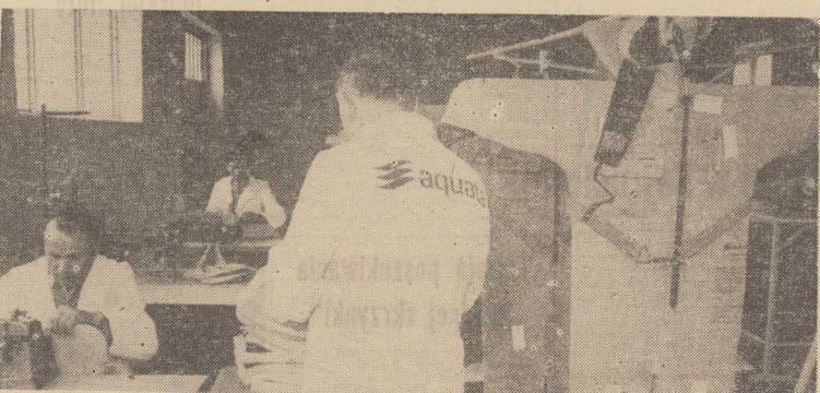
— WŁASNIE wczoraj wyprodukowaliśmy pierwszą partię polskich termicznych ubrań ratunkowych.

Jak nas poinformowano w szczyńskim PRZ w br. zakontraktowano przeszło 72 tys. ton pszenicy, podczas gdy w ub. roku o 15 tys. ton mniej. Należy sądzić, że skup będzie dużo większy od kontraktacji.