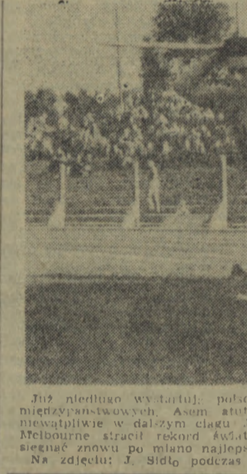
Już niedługo wydarzą się spotkania międzynarodowe...