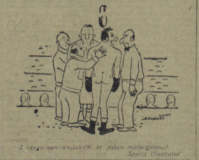
Z czego pan wnioskuję, że jestem rozluzniony? „Sports Illustrated”