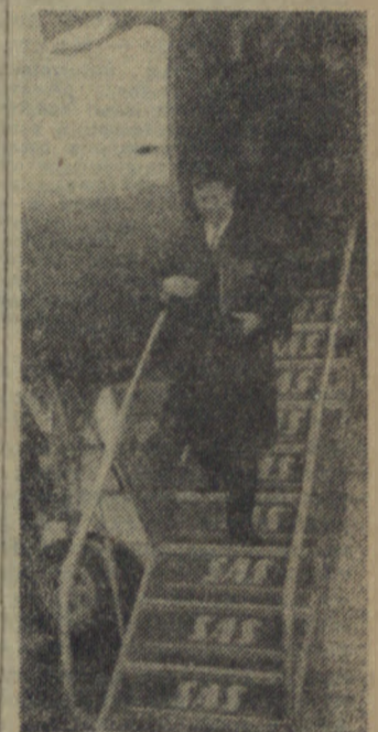
18 kwietnia br. na lotnisku Okęcie wylądował pierwszy samolot Skandynawskich Linii Lotniczych „SAS” obsługujący systematycznie komunikację lotniczą między Warszawą a Kopenhagą przez samoloty tego towarzystwa. Na zdjęciu: w chwili po wylądowaniu samolotu na lotnisku Okęcie...