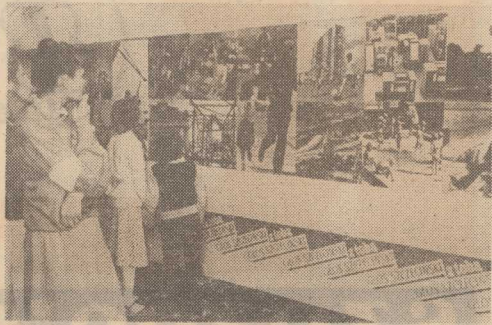
W NIEDZIELE otwarto w Zamku wystawę fotograficzną pt. 'Szczecin w 40-lecie'...