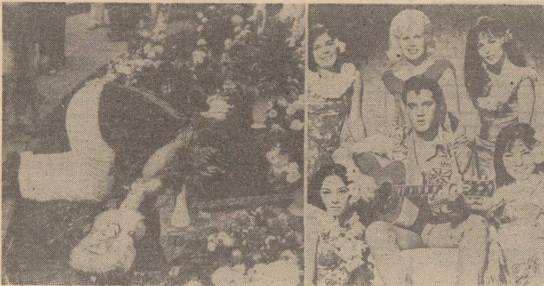
Z LEWEJ — płyta na grobie Elvisa w Memphis; Z prawej — scena z typowego „presleyowskiego” filmu.

„będzie można w miesięczniku „Literatura”, zapowiadającym już od dwóch numerów podobnie skandalizującą „story” (o Jimi Hendrixie) co dobiegająca właśnie końca opowieść o Presleyu.