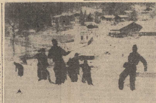
OSTATNIE przygotowania na obiektach sportowych w Seefeld, gdzie dziś nastąpi otwarcie mistrzostw świata w narciarstwie klasycznym.

zdobył na Zawodach Przyjaźni srebrny medal w kajakarstwie dwójce. Sukces ten znalazł swoje odbicie w typowaniach Czytelników, których głosy przyczyniły się do zajęcia przez kajakarza Wiskordzie II miejsca w naszym plebiscycie na najlepszych sportowców i trenerów Ziemi Szczecińskiej.