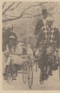
SZWAJCARZY też mają pój wyścig rowerowy. Wehikuły może nie tak szybkie, ale za to jakże zabawne.

BEIRUT PAP. W porcie Tripoli, w północnym Libanie, wybuchła bomba podłożona w samochodzie. Według wstępnych danych policyjnych, w której zginęło a ponad 30 zostało rannych. Samochodem-pułapką było tym razem czerwone „Volvo” wyładowane około 135 kilogramami ładunku wybuchowego. Wybuch zniszczył całkowicie czterotonowy ładunek. W znajdującym się na posterze siedziele przeżywał tłum ludzi, którzy padli ofiarą eksplozji.