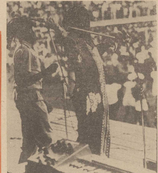
JUŻ po raz drugi gościć będziemy w Polsce zespół Misty In Rots. Przyjedzie na początku lipca, ponoć w nowym składzie powiększonym o dwóch saksofonistów.

w Opolu, właśnie za interpretację piosenki „Jaka róża...”. Edyta Geppert tak mówi o sobie i o piosence: „Piosenka to wynik współpracy z autorem tekstu, kompozytorem, orkiestrą i reżyserem. Powstaje w związku z tym łańcuch zależności, w którym piosenkarz w naszej estradowej rzeczywistości jest ogniwem najsłabszym. Chciałabym wykonywać teksty mówiące prawdy o życiu, niesprecyzne z tym co myśle i czuję. Niesłychanie trudne, kiedy wykonawca nie jest równocześnie autorem tekstów. Słyszałam od kogoś związanego z tzw. branżą, że mój gust traci myszka. Trudno...”