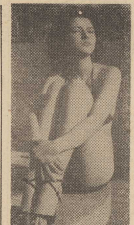
Jeszcze jeden słoneczny, upalny dzień.

BELGRAD PAP. Przewodniczącą Związku Rady Wykonawczej Jugosławii, Milka Planinc rozpoznała dziś wizytę oficjalną w USA. W czasie której spotka się z prezydentem USA, Ronaldem Reaganem. Tematem rozmów będzie sytuacja międzynarodowa oraz problemy dwustronnej współpracy gospodarczej, handlowej i finansowej.