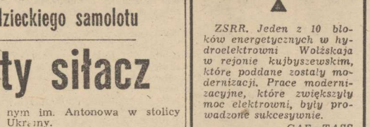
„Ruslan” — nowy radziecki samolot transportowy

BUDAPESZT PAP. Specjaliści ośrodka elektroniczno-obliczeniowego w Instytucie naukowo-badawczym językoznawstwa przy węgierskiej Akademii Nauk zbudowali niezwyklego pomocnika. Skonstruowali mianowicie komputer, który jest w stanie prowadzić rozmowę z operatorem, nasłuchując głos ludzki. Nowy robot potrafi odpowiedzieć na pytania po rosyjsku i węgiersku. Komputer takie może być z powodzeniem wykorzystywane w transporcie i w punktach dyspozytorskich.