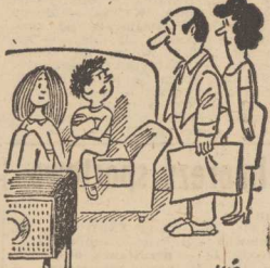
— Jeśli wam ten program nie odpowiada, możecie iść spać!