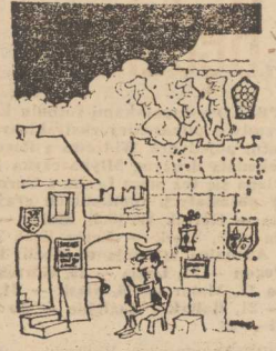
— Może to jest sposób na czwartego do brzydka?