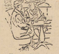
— Wczoraj odkryłam w mojej wadze łazienkowej cudowne urządzenie. Wystarczy nacisnąć guziczek i traci się 2 kilogramy.