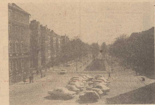
NIEDŁUGO niejedną Jedność Narodową przyozdobią kwiaty. Tamtejsze zielenie upiększane są roślinami przez Przedsiębiorstwo Zieleni Miejskiej w pierwszej kolejności. Biorąc zaś pod uwagę, iż rosnący bratki już nadają się do sadzenia na kłombach - ich wielobarwne kwiatki na pewno trafią do niebiosa.

NIE jest to problem nowy. Szczecinianie znają go od lat,