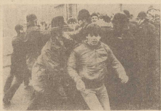
WIELKA Brytania. Policia interweniuje przed wejściem na teren kopalni Ollerton gdzie 14 bm. doszło do starć między górnikami i pikietami strajkujących górników z hrabstwa Yorkshire. Strajk górników brytyjskich objął 3/4 kopalń.

Nowy program będzie przede wszystkim kładł nacisk na emisję filmów. W tym celu podpisano porozumienie z kinematografią, umożliwiające wyświetlanie filmów już w rok po kinowej premierze. Do tej pory istniejące kanały nadawały program w najlepszym razie 12 godzin na dobę, podczas gdy w sąsiedniej Italii, podobnie jak w USA, telewizorami mogło nie wiać sprzed ekranów przez całą dobę.