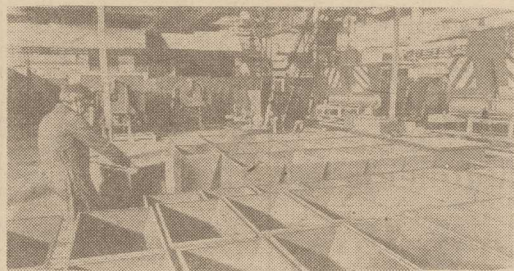
ZAKŁADY Zmechanizowanego Sprzętu Domowego „Predom-Metrix” w Tczewie, specjalizujące się w produkcji sprzętu wentylacyjno-wyciągowego, rozszerzyły asortyment wyrobów o rozwiązania pneumatyczne dwukomorowe do nawozów mineralnych. Zarówno sprzęt wentylacyjny, jak i rozseiwacze oprócz krajowych mają także nabywców zagranicznych.

Zaczęliśmy od ceny jaka dziś wiąże się z budową domku jednorodzinnego. Nie uważamy, że musi ona być tak wysoka. Potrzebne jest spełnienie jednak podstawowego warunku. A więc wprowadzenie technologii uprzemysłowionej, nawet tylko dla fragmentów tych inwestycji. Wcale też nie trzeba nowych rozwiązań w tej dziedzinie. Wystarczy sięgnąć po sprawdzone i wypróbowane wzorce stosowane dawniej i dziś, tak w kraju, jak i za granicą. (z)