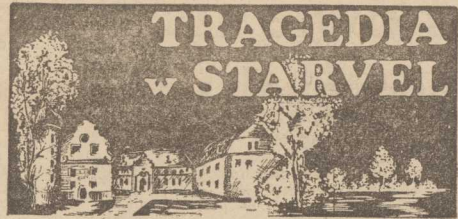
Przekład: Urszula Łada-Zabłocka, Krystyna Jurasz-Dąbska