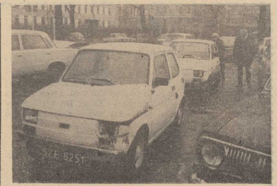
TAKI oto obrazek zaobserwowaaliśmy w wczorajszej gółodzie na podwórku PZU przy ul. Matejki. Niefortunni kierowcy z ciężkim sercem przyjechali po ycenę „stuczek” w swych pojazdach.