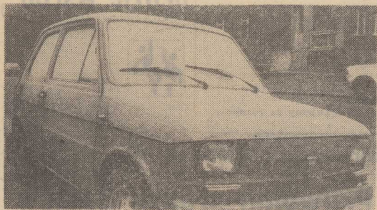
TEMPERATURA spadła poniżej zera. Wielu kierowców nie ruszyło swymi „czterema kółkami”. Zaszronione szyby, zamrożone zamki, a rozmrażacza w aerolu nie można nadsię kupić...