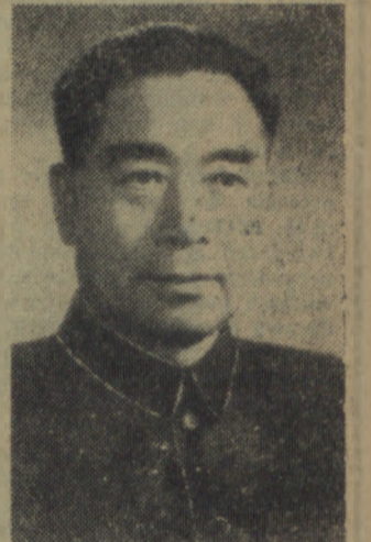
Na zdjęciu: premier Chińskiej Republiki Ludowej Czou En-lai.