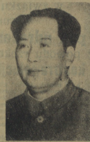
Na zdjęciu: przewodniczący Chińskiej Republiki Ludowej Mao Tse-tung.

Na zakończenie pobytu w DRW podpisano wspólne oświadczenie oraz układ kulturalny polsko-wietnamski.