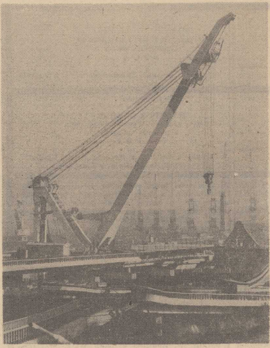
„MAJA” rozpoczęła swój kolejny pracowity pobyt w Szczecinie.

KPGO Gumienie w porozumieniu ze szkołą zorganizowało sprzedaż kwiatów doniczkowych. Najchętniej kupowano primule (35 zł za doniczkę) oraz paprocie (100 zł za sztukę). Przez 2 dni klienci nie odchodzili od tego stoiska. Dyrektor ZSO — mgr R. Sobieszkański — powołał ponadto Radę (wys)