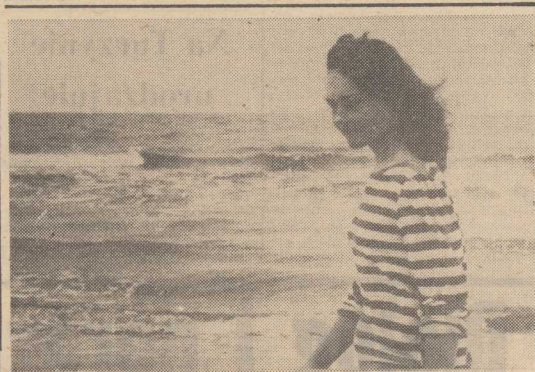
POGODA nadal dopisuje, choć noce i ranki są chłodne. Nad morzem coraz mniej wczasowiczów. Kończą się wakacje...

WASZYNGTON PAP. Inauguracyjny lot trzeciego wahadłowca „Discovery” we floty amerykańskich promów kosmicznych został odłożony po raz trzeci – o 24 godziny w związku ze stwierdzeniem wadliwego funkcjonowania tzw. czarnej skrzynki, mającej zapewnić właściwe oddzielenie się po zejściu od rakiet nośnych w dwie minuty po starcie. Poprzednio start „Discovery” był odkładany dwukrotnie 25 i 26 czerwca br. Dzisiejszy, który miał nastąpić o godzinie 12.35 czasu GMT został odwołany przez NASA o godzinie 1.10 GMT.