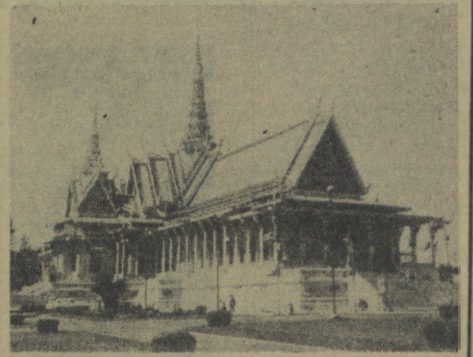
KAMBODŻA. Na zdjęciu: pałac królewski w Phnom Penh. (FOT — CAF)