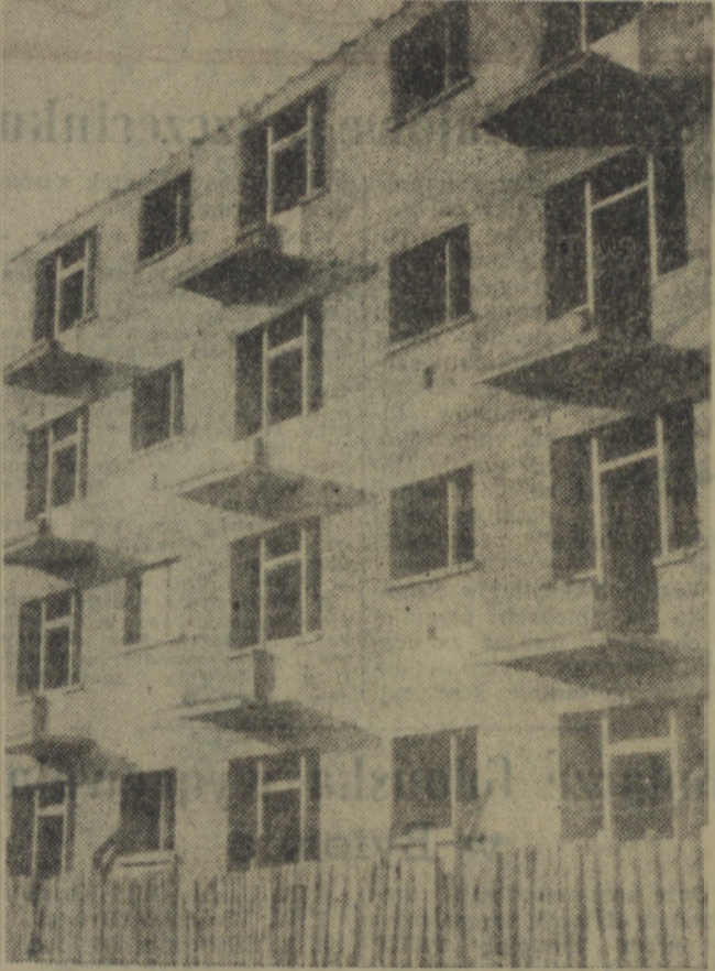
Ten budynek przy ul. Zwycięstwa zapowiada się wcale okazale. Tylko kiedy zostanie ukończona jego budowa?