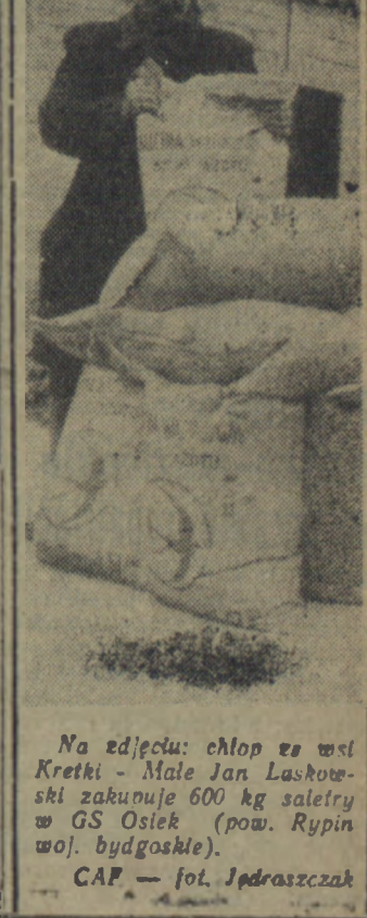
Na zdjęciu: chłop z wsi Kretki - Mała Jan Laskowski zakupuje 600 kg saletry w GS Osiek (pow. Rypin woj. bydgoskie).

NA rozpoczynające się w tym wiosenne rolnictwo nasze otrzymało już prawie 1 300 tys. ton wszystkich rodzajów nawozów szlucznych zarówno z fabryk krajowych jak również z importu.