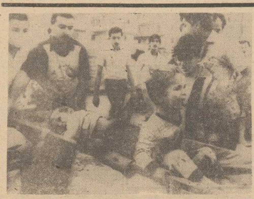
Przejmujący władzę członkowie nowego rządu Argentyny.

BUENOS AIRES LONDYN PAP. Prezydent-elekt Argentyny, Raul Alfonsín mianował we wtorek wieczerem członków nowego rządu, który przejmie władzę od gabinetu wojskowego w przyszłym miesiącu. Ministrem spraw zagranicznych mianowany został socjolog Dante Caputo, który kierował kampanią wyborczą Raula Alfonsína w październiku br.