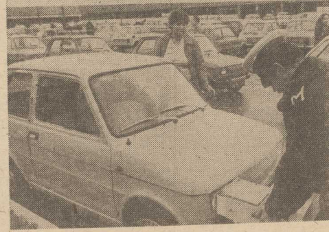
formacje o stwierdzonych usterekach.

— Z przeprowadzonych badań — naśwadała się smutne wnioski — dorzuca inż. Miodeńca. Ze ustawione światła stwierdziliśmy w wielu pojazdach, ponad 200 samochodów miało skorodowane reflektory w stopniu nie gwarantującym prawidłowego oświetlenia. Odgłosy zewnętrzne wykazywały niewłaściwe zużycie opon spowodowane złym ustawieniem geometrii kół.