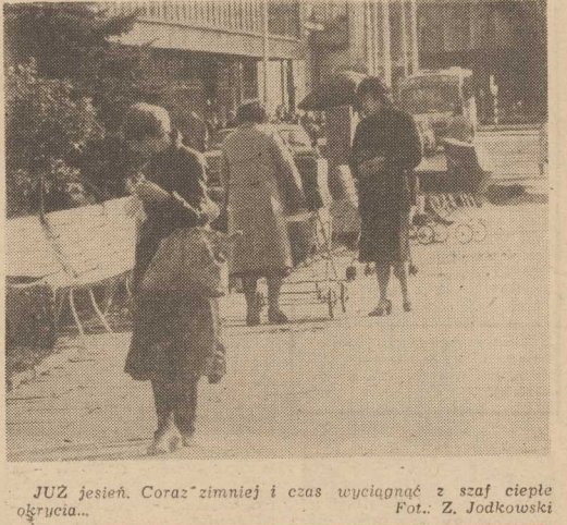
JUZ jesień. Coraz zimniej i czas wyciągnąć z szaf ciepłe okrycia...

ZESPÓŁ Teatru Współczesnego w Szczecinie informuje miliończyków, że w dniach 25, 26, 27, 28, 29, 30 października br. o godz. 19 odbędzie się już ostatnie spektakle „Operetki” Witolda Gombrowicza. Po upływie tego terminu sztuka schodzi z afisza.