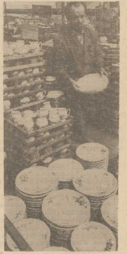
O JAKOŚCI i urodzie porcelany z Chodzieży — garniturów do kawy, serwisów obładowanych i tzw. galerii decydują w dużej mierze ciekawość zdobnictwa, systematycznie wprowadzane nowe wzory oraz dopracowana pod każdym względem technologia produkcji. W tym roku wprowadza się z dobrymi wynikami krajowy gips do formowania i nowy rodzaj farb przygotowanych przez Instytut Szkła i Ceramiki. NA ZDJĘCIU: w Zakładach Porcelany i Porcelitu w Chodzieży (woj. polskie).