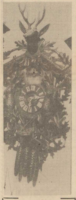
PIEKNY stary zegar z Kolekcji Muzeum Rzemiosł Artystycznych i Przemysłowych w Warszawie.

OKAZUJE SIĘ, że nawet szufla i myszolatki mogą być przedmiotem opłacalnego eksportu. Niewielka spółdzielnia pracy w Aleksandrowie Kujawskim robi na nich niejako „mimochodem” — obok podstawowej produkcji — interes od blisko 12 lat. W br. ok. 100 tys. pałówek na grzybnie wyeksportowane już do RFN, a wykonywane jest kolejne zamówienie dla Nigerii. Uzyskiwane dawno operatywna spółdzielnia przeznaczająca na zakup za granicą surowców i materiałów niezbędnych do innych wyrobów dla rynku krajowego.