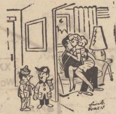
— Chcesz zobaczyć jak zarabia się pieniądze na kino?