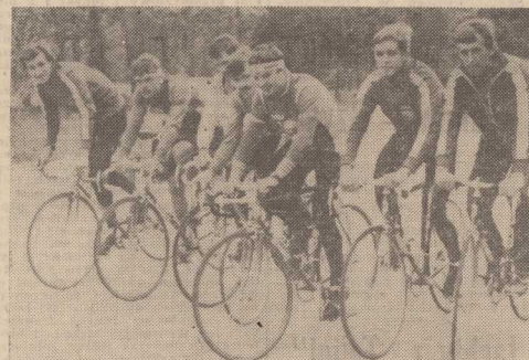
KADRA polskich kolarzy, z których wytypowany został zespół na Wyścig Pokoju przebywa w Rybniku, gdzie odbywa ostatnie treningi.

Przypuszczam, że gdyby dzisiaj należało ogłosić decyzję, prezydent bez wahania zgłosiłby swoją kandydaturę do następnej kadencji — oświadczył Edwin Meese.