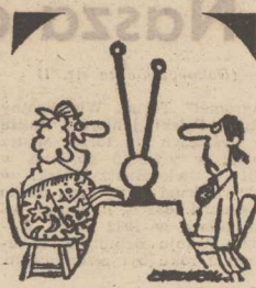
— Przy dobrej widoczności, dostrzegam 1987 rok!