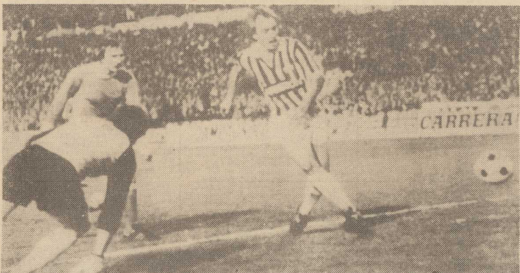
Mecz w Turynie. Bettega strzela bramkę. Czy wystąpi dziś w Łodzi?

WROCŁAW PAP. Ostatnie ciepłe dni także we Wrocławiu „przelamaly” niezdecydowanie świata przyrody — delikatnymi, różowymi pąkami zakwitły wreszcie liczne krzewy magnoli, które są wiosenną ozdobą miasta. W nadodrzańskich parkach widać także piękne, obficie obyspane kwieciami krzewy forsycji, zaczynają się rozwijać pąki kasztanów.