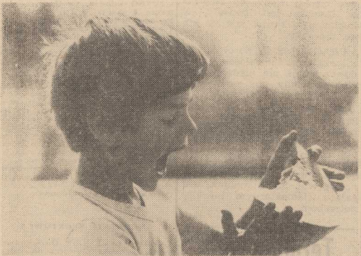
ACH, JAKIE PYSZNE!