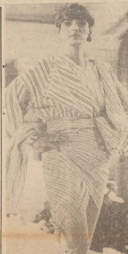
DLA PAŃ z fantazją: strój z kolekcji Mody Polskiej.

WARSZAWA PAP. Obecna pogorszenie pogody ma charakter krótkotrwały. Instytut Meteorologii i Gospodarki Wodnej przewiduje w okresie od 13 do 17 bm. stopniowe ocieplenie. Początkowo w dniach 13-14 bm. spodziewane jest zachmurzenie duże z rozproszonymi i okresowymi opadami oraz z możliwością lokalnych burz. Temperatury maksymalne będą od 15 do 20 st., zaś min. małe od 7 do 13 st. Wair umiarkowany, okresami silny z kierunków zmieniających się. Następnie w dniach 15-17 bm. spodziewane jest zachmurzenie umiarkowane okresami duże z opadami. Nastąpi ocieplenie. Temperatury maksymalne będą od 18 do 24 st.