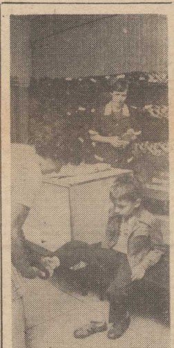
Może ten będzie pasował?