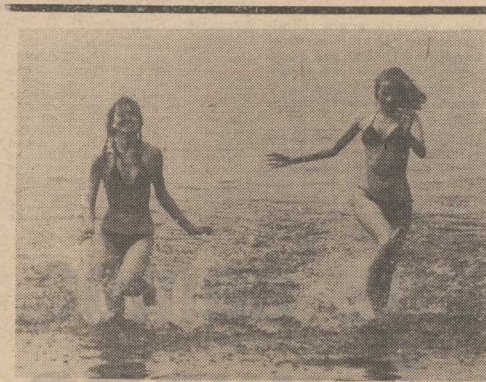
Piękne dziewczynki i lato...