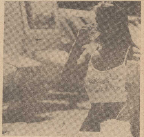
I znowu żar się z nieba leje...

Dowiedzieliśmy się także w WPEC, iż zgromadzono już spore zapasy opatu wyjątkowo w tym roku. Na placach składowych przy kotłowniach jest już go tyle, że bez obaw myśli się o zimie (mg)