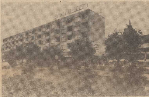
NOWOGARDZKIE NOWE MIASTO.