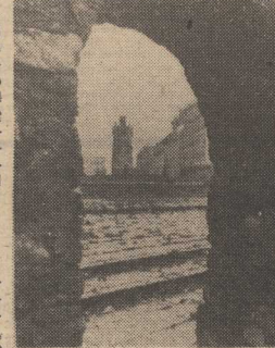
PRZED WIEKAMI miał Nowogard potężne fortyfikacje, które niejednemu napastnikowi skuteczny opór stawiały. Dzisiaj ich resztki pełnią rolę wyłącznie dekoracyjną...

jednostki administracyjne powstały właśnie istnieć taki biurowiec? Toż to w nowych województwach urzędy wojewódzkie tak reprezentacyjnych siedzib nie mają! Podjęto więc kolejne decyzje. Na ich mocy nowym właścicielem tego „wstydliwego” obiektu stała się „Pomerania”. „Tyłko” 7 lat trwa-