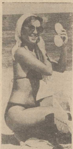
PLAŻOWY USMIECH...

JEST jednak faktem że wiele przedsiębiorstw boryka się z rzeczywistym brakiem kadr. Ze bariery zatrudnieniową uniemożliwia im zwiększenie produkcji. Rece do pracy stały się nie mniej ważnym środkiem produkcji niż surowce i materiały. Wobec pełnej swobody, jaka przedsiębiorstwa mają w kształtowaniu poziomu i struktury zatrudnienia, na rynku pracy toczy się walka o ludzi, a wygrywa w niej często ten, który najbardziej potrzebuje pracowników, lecz ten, który obieca najatrakcyjniejsze warunki. W tej sytuacji uznano, że potrzebne jest sterowanie procesami rynku pracy w najtrudniejszym okresie wychodzenia z kryzysu.