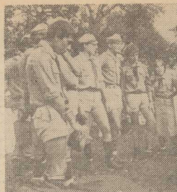
OBOZOWE ŻYCIE...

Jeśli chodzi bowiem o samą bieżącą „produkcję” pszczoł — to obecnie nie sprzyja jej utrzymująca się od dłuższego czasu — susza. Wiele zależy jeszcze od przebiegu pogody w najbliższych tygodniach. W każdym razie ocenia się, że jeśli nawet ubiegłoroczny miodowy rekord nie zostanie w tym sezonie pobity, to skup tego produktu na pewno ukształtuje się na zbliżonym poziomie. (PAP)