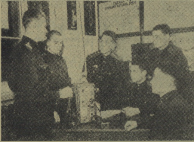
W oddziałach Armii Radzieckiej. Na zdjęciu: szkolenie żołnierzy łączności...

KIEDY tworzono ją, Rosja stała w ogniu rewolucji, a obca interwencja zmierzała do utrzymania nad Wolgą porządku, który miał uszczepić Europie przed za rażliwym przykładem „leninowskiego eksperymentu”. 23 lutego 1918 roku pierwsze oddziały wojsk radzieckich rozbiły pod Pskowem i Narwą dywizje niemieckich najezdźców. Oto i dzień narodzin Armii Radzieckiej. Armii, której pierwszym zadaniem było wystąpienie przeciwko siłom rozbitym i obcym. Tym siłom, które chciały prześladować się wyrwaniu Rosji z łańcucha państw kapitalistycznych, gdyż zdawały sobie sprawę, że zmienią to układ sił europejskich czy światowych na ich niekorzyść i wprowadzi proletariusz innych krajów na drogę rosyjskiego Października.