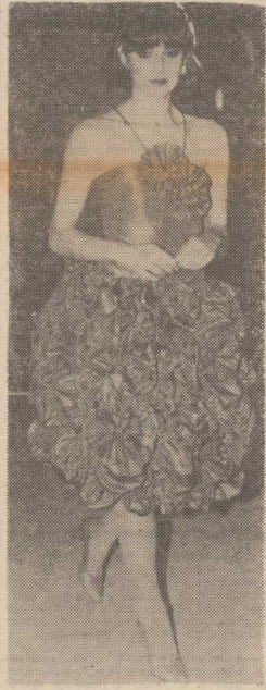
SUKNIA-BOMBKA z drapowanej tafty — model parwskiego projektanta Ungara.

krywa się bowiem, że przy wprowadzaniu reformy nie ustrzeżono się pewnych pomyłek. W żadnym wypadku jednak — co zaakcentował Stanisław Ga- (Dokończenie na str. 2)