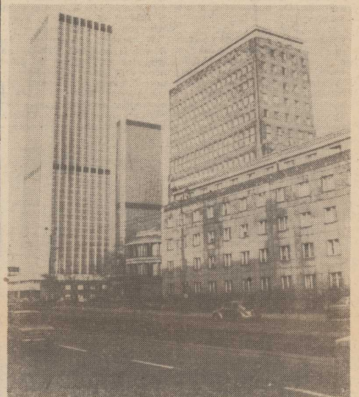
NOWOCZESNA architektura Warszawy w 38 lat po jej wyzwoleniu.