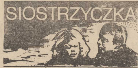
Tłumaczył Piotr Kamiński 85