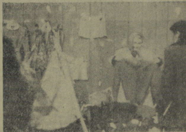
Proszę bardzo... jartuski, sweterki — do wyboru, do koloru...

Koszalińskim „ciuchom” daleko do „świeżości” tamtych. Tu znaleźć można tylko stosy rannych pantofli, dziesiątki sukien sztychanych na jeden model. Zdarza się jednak czasem, że i tu znaleźć można jakąś naprawdę ładną rzecz — sweter, kupon materiałowy. Bywa to najczęściej wtedy, gdy poprzednia go dnia do „Galluxu” względnie któregoś ze sklepów tekstylnych przywiozą atrakcyjne towary. (Uwaga PII).