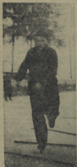
Zdjęcie 3. Zanim dostaną kijki do ręki muszą się nauczyć jeździć „przekładanką”, stać w postawie hokeisty, opadać, hamowanie, nauczyć się szybkiego startu itd. Na razie kijki służą jako przeszkody ułożone na lodzie, które trzeba w pełnym rozpędzie przeskoczyć.

Oprócz zwerbowania sporej ilości starszych, dobrze zapowiadających się zawodników, utworzyli w br. przy swoim klubie szkołę hokejową dla młodzików. Kilkunastu młodych chłopców w wieku 13—14 lat dwa razy w tygodniu uczy się zasad prawidłowej jazdy na lodzie, operowania kijkiem i wszystkiego tego, co powinien mieć w krwi przyszły zawodnik drużyny hokejowej.