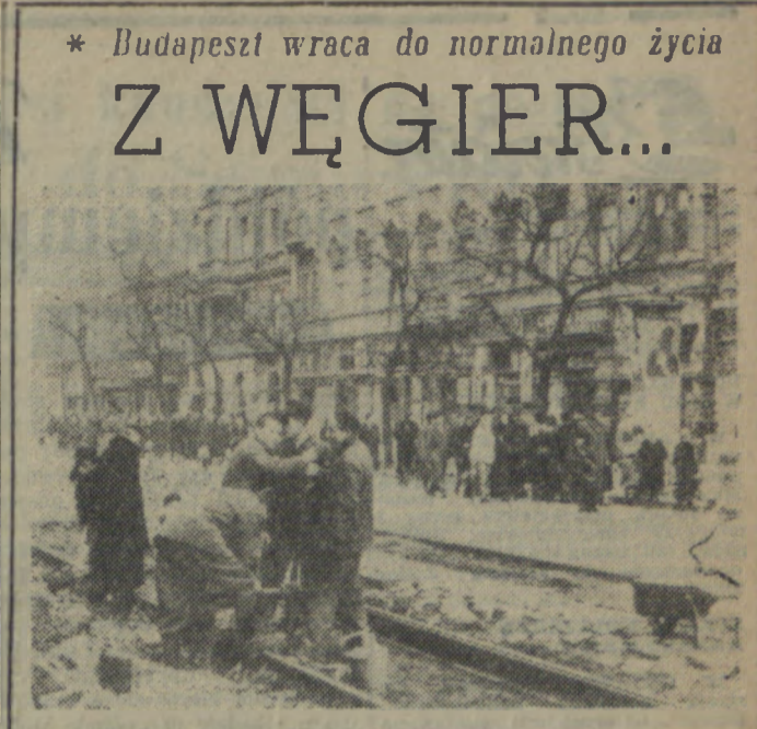
* Budapeszt wraca do normalnego życia Z WĘGIER...