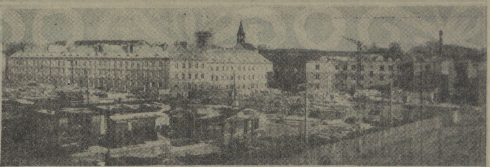
KOSZALIN — WIDOK NA NOWOBUDOWANE ŚRÓDMIEŚCIE

Program dnia: 5.55, 15.05. Wiadomości: 6.00, 6.00, 7.00, 8.00, 8.30, 12.04, 16.00, 20.00, 23.50.