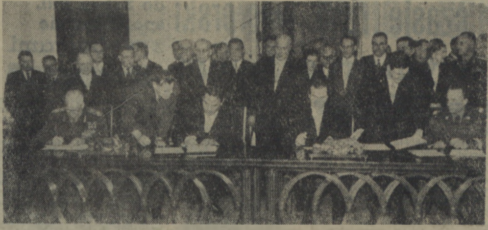
Na zdjęciu: układ podpisują ze strony polskiej: minister spraw zagranicznych A. Rapacki i minister obrony narodowej gen. dyw. M. Spychalski, ze strony radzieckiej: minister spraw zagranicznych ZSRR D. T. Szepilow i minister obrony narodowej ZSRR marszałek G. K. Zukow.