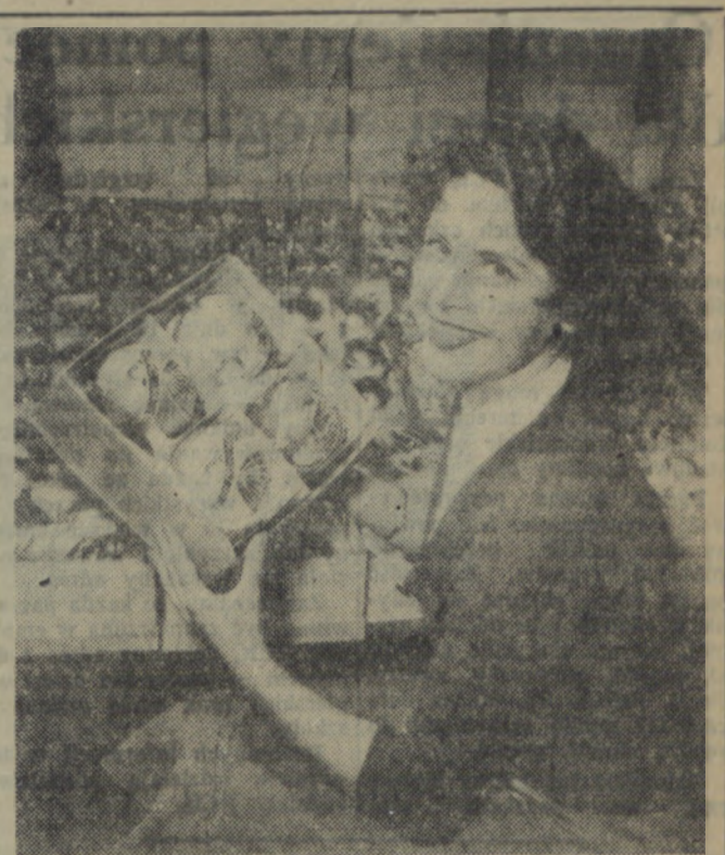
Wybieramy ozdoby na choinkę.

W planie 5-letnim uwzględniono również m. in. następujące wnioski: zagospodarowanie zamku w Bytowie, zelektryfikowanie wsi Wierchowo pow. Drawsko i Szczeglin pow. Koszalin, odbudowę m. Karłina, remont hotelu w Miaszku, odbudowę basenu pływackiego w Dębnie Kaszubskiej, przydzielenie odpowiednich środków finansowych na remont pałaców i zamków, w których znajdują pomieszczenia szkoły i ośrodki zdrowia.