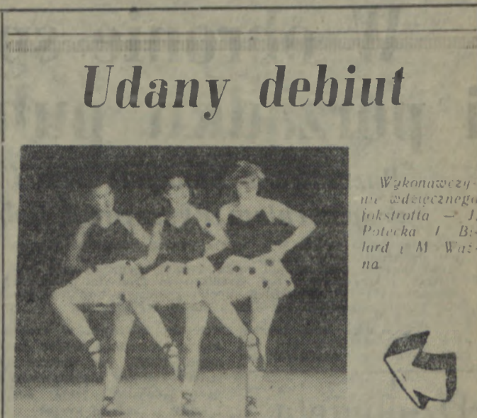
W ub. niedzielę odbył się pierwszy występ baletu WDK.

Czy nie można by wysypać tych miejsc żużlem?