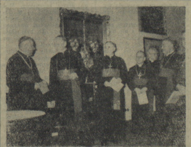
14. XII br. odbyła się w Episkopacie Konferencja Plenarna, podczas której ks. Kardynał Stefan Wyszyński — Prymas Polski wręczył nowonominowanemu biskupom na ziemiach zachodnich nominacje zatwierdzone przez Watykan.