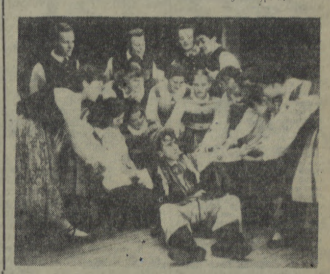
Scena zbiorowa z widowiska tanecznego — pt. „Karczma”.

Występi młodych artystów cieszyli się dużym zainteresowaniem mieszkańców Koszalina. Świadczą o tym m.in. wypełniona do ostatniego miejsca widownia i rzęsiste brawa.