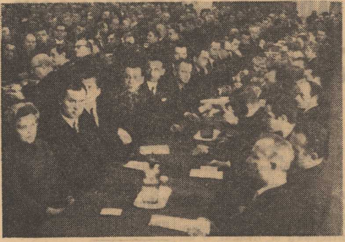
Na zdjęciu: fragment sali obrad Okręgowej Konferencji PZPR w Szczecinie.