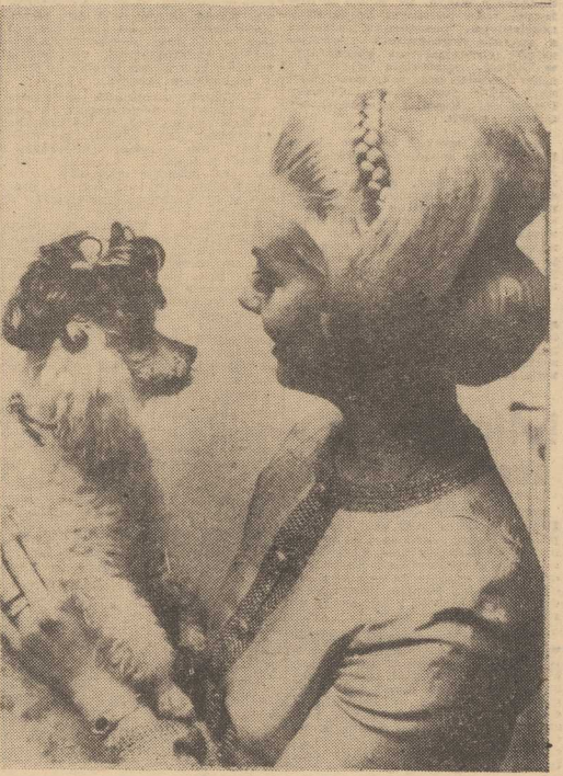
Egz obow Red 5/69