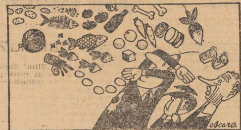
— Co to? Przenosiny Hal paryskich? — Nie... to Wspólny Rynek...

W ostatnich dniach przybył do Rzymu arcybiskup krakowski, kardynał Karol Wojtyła. Uczestniczył on w dorocznej sesji rady kościelnej do spraw katolików świeckich, której jest członkiem. Ktoś kardynała Wojtyłę w Rzymie potrwa około dwóch tygodni.