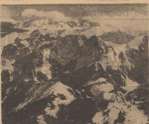
PANORAMA TATR z lotu ptaka — na pierwszym planie Giewont.

Liczni dyskutanci zwracali uwagę na konieczność rozwijania produkcji wyrobów garmażeryjnych i półfabrykatów spożywczych oraz ich sprzedaży w zakładach pracy. Celowe jest także uruchamianie w zakładach kio-