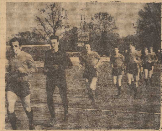
Burzą braw powitała szczecińska publiczność wbiegającą „jedenastkę” Pogoni.

S ZCZECIŃSKI Turystyczny Klub Kolarski-88 działający przy Oddziale Miejskim PTTK jest jednym z najlepiej pracujących klubów tej organizacji. Ostatnio podsumowany został organizowany przez Komisję Turystyki Kolarskiej ZG PTTK, konkurs na najaktywniejszy turystyczny klub kolarski PTTK. Szczecińscy kolarze - turyści sklasyfikowani zostali na wysokim, 5 miejscu. W nagrodę przyznano im kuchenkę benzynową i kilka gumowych matraców. (ja-gr)