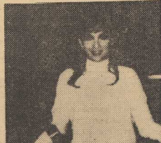
WŁOSKA aktorka Gina Lollobrigida, która w ubiegłym miesiącu uległa wypadkowi samochodowemu i była operowana, znajduje się obecnie w klinice w Rzymie i próbuje chodzić o własnych siłach.

Dania stoi w obliczu największego w swej historii strajku. Zapowiedział wystąpienie do akcji strajkowców ogółem już kilkanaście wieloletnich związków zawodowych m. in. pracowników przemysłu metalowego, górniczego, handlu, transportu towarowego, przemysłu drzewnego, marynary, a także pracowników biurowych — przeszedłszy łącznie blisko 900 tys. osób. Nie jest wykluczone, że liczba uczestników strajku wzrośnie do blisko 0,5 mln osób. Tytułowo członków liczą w sumie związki, które weszły w konflikt z przedsiębiorstwami na etapie negocjacji o nowy wieloletni układ zbiorowy (obecny układ zbiorowy wygaś z dniem 1 marca br.).