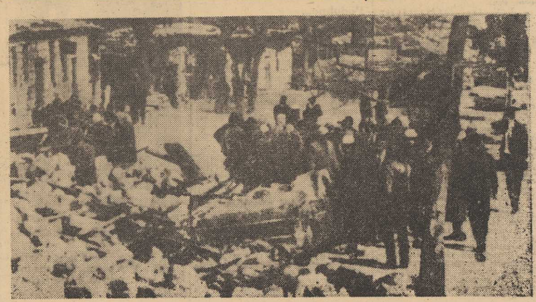
34 bm. lotnictwa izraelskiego bombardowało dwa miejscowości na terytorium Syrii - El Hamma i Messalin. Samoloty nieprzyjańskie napotkały na silny ogień artylerii przeciwniczej. Jedna maszyna została stracona. Na zdjęciu: budynek urzędu celnego w Messalin bombardowany przez lotnictwo izraelskie.

NOWY JORK PAP. Z niewiadomych jeszcze przyczyn w samym centrum Nowego Jorku wybuchł we wtorek wieczorem wielki pożar 5-piętrowego budynku, w którym mieszkały się biura architektoniczne jednej z firm budowlanych. Pożar poprzedziła eksplozja w jednym z biur na 3 piętrze. Ogień dyktawicznie się rozszerzył, obejmując wkrótce cały budynek. Wśród personelu wybuchu panika, zaczęło wyskakować z okien. Tragicznie zakończyła się próba grupy robotników, którzy w windzie usiłowali zjechać na dół. Nastąpiła awaria windy stanęła w wyniku czego kilka osób spaliło się żywcem. W płomieniach poniosło śmierć 9 osób, a dziesiątki poparzonych odwieziono do szpitala.