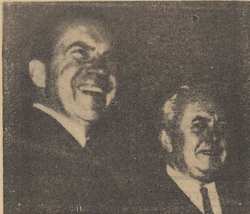
W drugim dniu podróży po Europie prezydent Nixon przybył do Londynu. Na lotnisku witał go premier W. Brytanii Harold Wilson (z prawej).

W Oslo zakomunikowano oficjalnie, że od 14 do 18 marca odbędzie się w południowej Norwegii manewry. Jak oświadczył norweskie Ministerstwo Obrony, w manewrach będą brały udział tylko wojska norweskie.