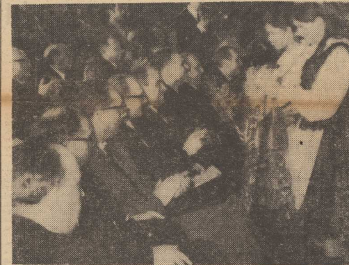
Nowe elementy w procesie Shawa