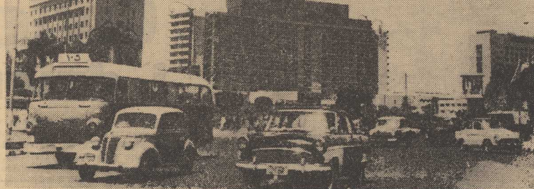
FRAGMENT śródmieścia stolicy ZRA - Kairu.

W ROKU SZKOLNYM 1968/69 istnieje 849 szkół podstawowych, do których uczęszcza 174,1 tys. uczniów. W miastach i osiedlach czynnych jest 149 szkół o liczbie uczniów 106,3 tys., podczas gdy na wsi zlokalizowanych jest 703 szkół. W czerwcu 1968 r. ukończyło szkołę podstawową 19 548 absolwentów. W 12 liceach młodzieżowych ogólnokształcących pobiera naukę w roku szkolnym 1968/69 łącznie 9 341 uczniów, w tym 6 772 dziewcząt i 2 569 chłopców. W 1968 r. zdanie egzaminu dojrzałości 2 025 osób, w tym 690 chłopców i 1 335 dziewcząt. W 16