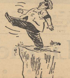
Mao: „Naprzód, ciągle naprzód“

POJAWIENIE SIĘ tego artykułu nie jest rzeczą przypadkową. Niedawno jeszcze większość ludności całego kraju z apatią oczekiwała końca „rewolucji kulturalnej“. Wówczas głównie ciąsą zadawano kierowniczym kadrom. Teraz z pozoru niewinne sformułowanie - „walka, krytyka - reedukacja“, oznacza rozszerzenie czystki i obejmuje szerokie kręgi ludności. Wywołuje to nie ukrywane niezadowolenie. Dzienniki pekińskie podkreślają w związku z tym, że „wrogowie stają się coraz bardziej zaciekli“.