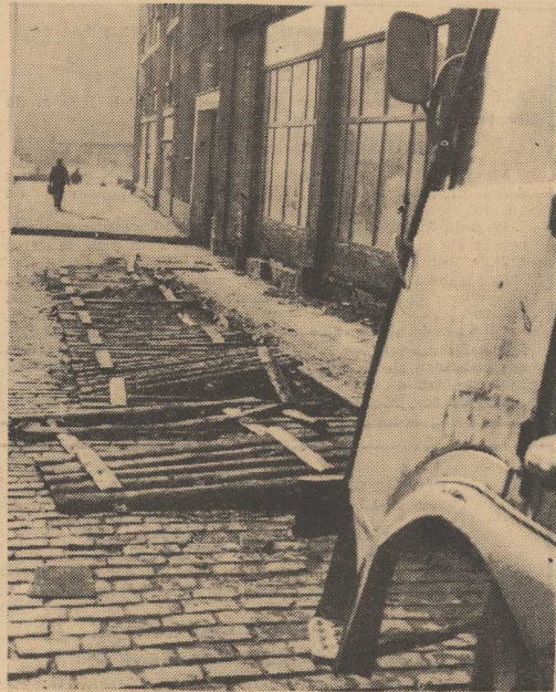
Na zdjęciu rozwalony płatek „zabezpieczający” budynek przy ul. Grodzkiej. Termin zajęcia chodnika zgodnie z wydanym zezwoleniem minął w roku 1968.