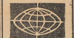
WYNIKI WYBORÓW W JAPONII

WLADZE stanowe Kalifornii posta nowymi złagodzić zakazy strojów „topless” i „bottomless” w lokalach rozrywkowych tego stanu. Rozporządzenia, zakazujące używania tego rodzaju strojów, uznano za sprzeczne z prawodawstwem stanowym. Nowe przepisy w tej sprawie mają jednak wejść w życie dopiero w przyszłym roku. Decyzję tę powzięto pod naciskiem właścicieli lokalów rozrywkowych, którzy wskutek wprowadzenia zakazu mieli poważnie zmniejszone dochody.