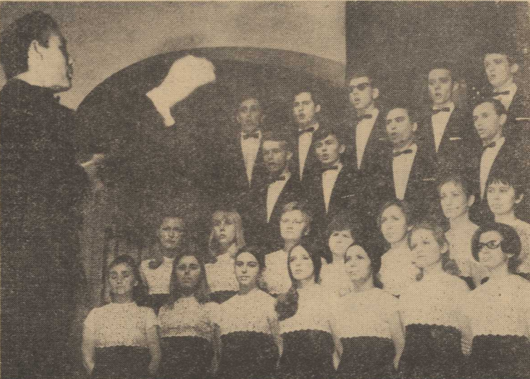
PODCZAS Koncertu Zamkowego wreczona została Statueta Chorolich Politechniki Statueta Trygława...