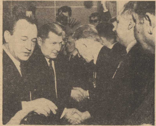
NA ZDJĘCIU: zasłużonych pracowników PGR dekoruje z-ca członka Biura Politycznego KC PZPR, minister Rolnictwa M. Jagielski w towarzystwie I sekretarza KW PZPR — Antoniego Walaszka.

Uczestnicy spotkania wystosowali także oświadczenie dotyczące agresji amerykańskiej w Wietnamie, potępiające agresorów i zapowiadające udzielanie dalszego wszechstronnego poparcia słusznej walce narodu wietnamskiego. Pełny tekst oświadczenia zamieszcza dzisiejsza prasa poranna.