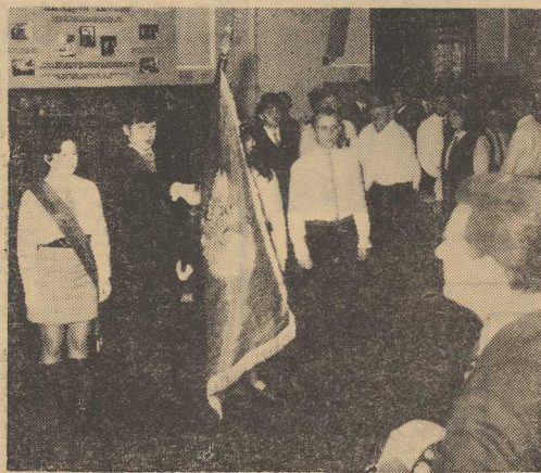
Na zdjęciu: moment dekoracji sztandaru wojewódzkiej organizacji ZMW.