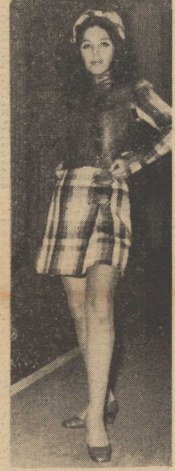
SUKIENKA z wełny w kratę, z dużą kontrastową przypinaną na paski ze skajy. (CAF-Langda)