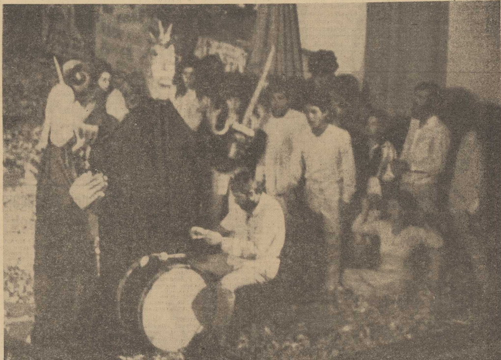
NA ZDJĘCIU: grupa członków Bread and Puppet Theatre w zaimprovizowanym fragmencie przedstawienia.

biorstwa, z planem usług, z etatami i planem repertuarowym, pozostającego na Zachodzie.