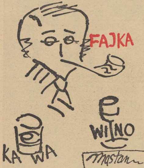
I tak przez okrągły roczek (wieczny bywalec klubowy).

Na szczególne wyróżnienie zasługuje młodzież woj. kosszalińskiego. Na alert ogłoszony przez Zarząd Wojewódzki ZMW i ZSP - tylko w okresie dwóch październikowych nędzi - pracowało na kosszalińskich polach ponad 6 tys. młodzieży, zaś w całej kampanii wykopkowej uczestniczyło w tym województwie - ok. 80 tys. junaków.